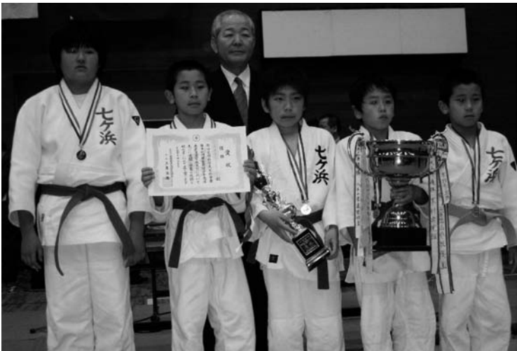
◆小学生団体の部 優勝 七ヶ浜柔道スポーツ少年団A