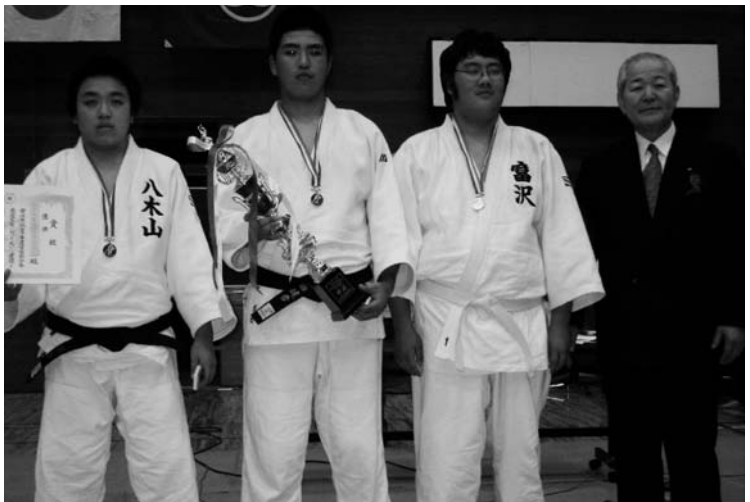
◆中学生団体の部 優勝 八木山柔道愛好会A